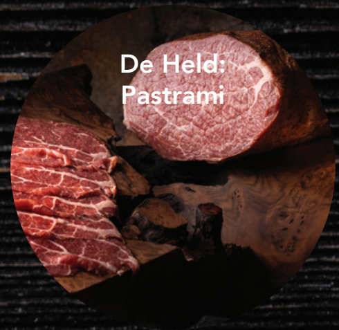
De Held: Pastrami

Runderborst (beef brisket), traditioneel langzaam gegaard en licht gerookt +/- 2 kg • Kenmerkende mix van paprika, koriander en venkel • Mals en sappig • 58 dagen houdbaarheid (gekoeld).